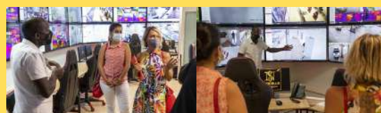
Janvier 2021 - 1ère rencontre et élaboration du partenariat

Retour en Image sur la genèse du projet.