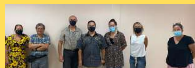
Février 2021 : Présentation aux équipes, Planification - 1er comité de pilotage